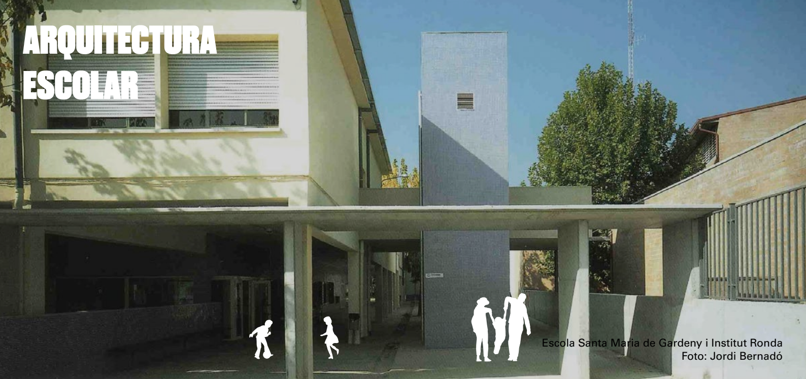
Escola Santa Maria de Gardeny i Institut Ronda